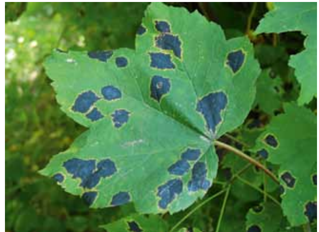
Figuur 1. Esdoornblad ( Acer pseudoplatanus ) bedekt met “European tar spot” ( Rhizoglyphis glyceris ).

De meeste klinische symptomen ontstaan door degeneratie van de skelet- en ademhalingsspieren.