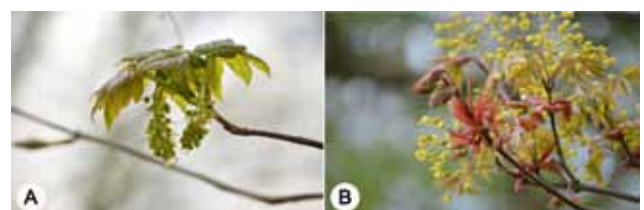
Figuur 4. A. Acer pseudoplatanus bloemen hangen in trossen. B. Bloem van de Acer platanoides .