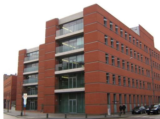
VAC - Hasselt

Vanaf 19u is er gratis parkeergelegenheid op de parking Koningin Astridlaan tegenover het VAC (350 plaatsen).